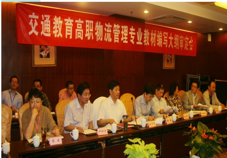
交通教育高职物流管理专业教材编写大纲审定会议